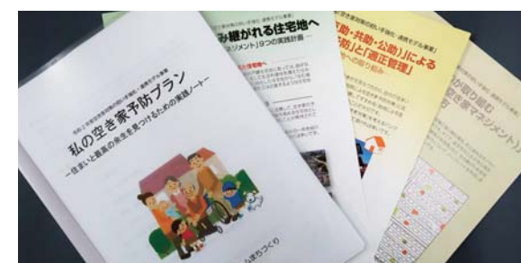
空き家まちづくりパンフレットの発行