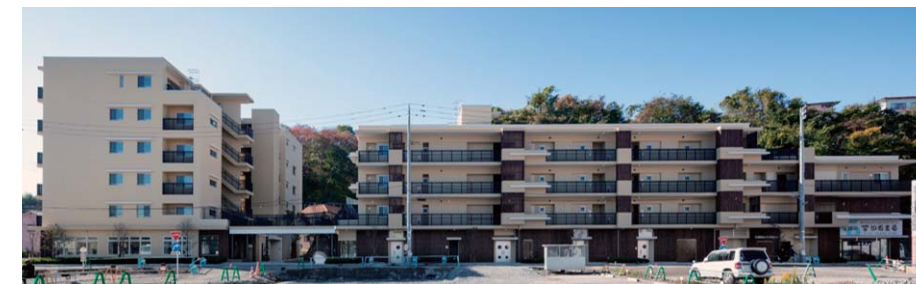
気仙沼市南町一丁目地区 まちなか復興型共同化事業