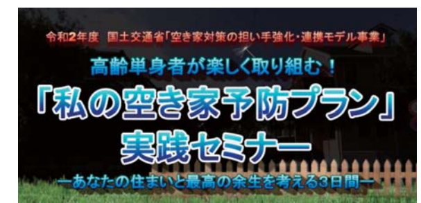
「私の空き家予防プラン」実践セミナー 動画製作・公開