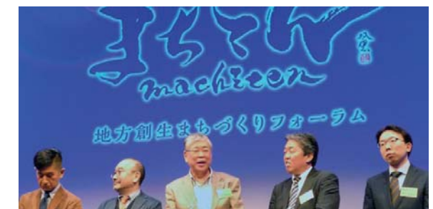
まちづくり EXPO「まちてん」に出展